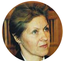
НАИЛӘ ГҮЙЛӘЖЕВА, Олимпия чемпионы, Татарстанның фехтование федерациясе вице-президенты

Бездә юниорлар арасында Европа беренчелеге узганы булды. Ә менә Дөнья чемпионаты кебек турнирлар турында хыялла-на гына ала идек. Шуңа күрә бу ярыш безнең өчен бәйрәм ке-бек булды. Дөнья чемпионатының Казанда узуы фехтование спорты гына түгел, Татарстан башкаласы өчен дә әһәмиятле. «Рубин» белән генә танылып булмый бит инде. Ә фехтовани-едә күптәнне традицияләребез бар. Кызганыч, Россия җыелма командасына бездән беркем дә әләкмәде. Чемпионнарны тиз генә ясап булмый шул. Әмма өметле спортчыларыбыз бар. Исемнәрен әйтеп күз тидерәсем килми. Планета беренчеле-гендә кемнең фаворит буласын да әйтә алмыйм. Фехтование спортының географиясе бик киңәйдә соңгы елларда. Хәзер бу спорт төре белән Гондураса да, Индонезия белән Доми-никана Республикасында да шөгьльләнәләр. Жиңә алырлык спортчылар бик күп илләрдә бар. Ә фаразлар ясамыйм. Ми-нем өчен спортчыларның медальләре түгел, аларның техни-касы, ничек чыгыш ясаулары кызык.