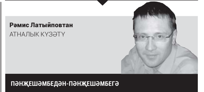
Рәмис Латыповтан АТНАЛЫК КҮЗӘТҮ

Мамадышта Кирпичная урамында юл өслегенең ватылып беткәнлеге турында хәбәр иткән булганнар, файдасы тигән – хәзер ул юл төзек. Нурлатта бер ишегалдының жиңереклеге турында хәбәр яңгырауға үк, биредә берне генә түгел, ә 50 ишегалдын төзекләндерү буенча жирле программа кабул ителгән. «Халык контроле»ндә Казан, Чаллы, Түбән Кама, Элмәт, Бөгелмә, Лениногорск, Кукмара, Яшел Үзән, Нурлат, Биектау, Лаеш һәм Чистай муниципаль берәмлекләреннән хәбәрләр күп керә, әмма аларда күпчелек мәсьәләләр уңай чишелеш таба бара. «Министрлыклар һәм ведомстволар хәбәрләр белән танышып тора, мәгълүмат Татарстан Президентына да жеткерелә», – диде Рөстәм Низамиев.