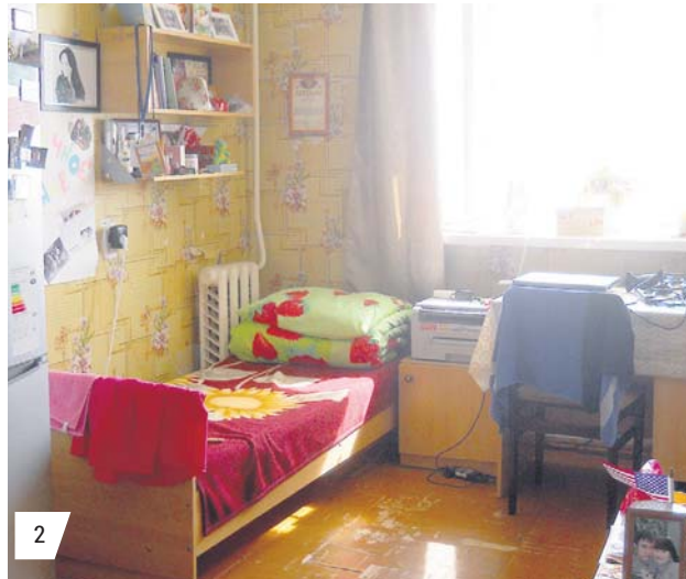
1 Универсиада авылындагы шартлар. 2 Студентлар шәһәрчегендәге бүлмә.

Энергоуниверситетта укыгандагына түгел, тулай торақта яшәгәндә дә балл-рейтинг системасы хөкем сөрә. Университет торышында актив катнашкан студентлар сессиясендә автоматка яба, тулай